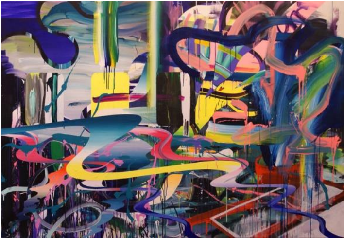
Avgang før dagen gryr .